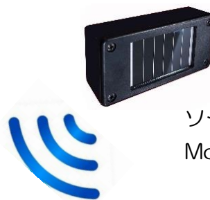
ソーラー発信器 Model 7591