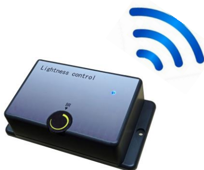
無線コントローラ